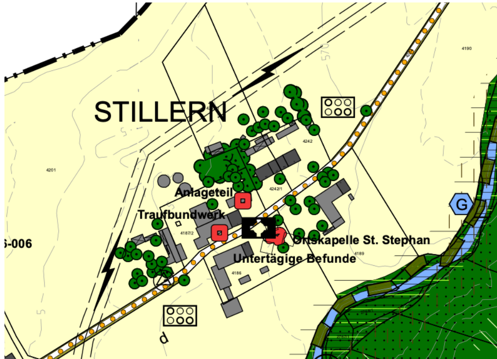
Ausschnitt aus dem rechtswirksamen FNP

Der seit dem 28.05.2019 rechtswirksame Flächennutzungsplan der Gemeinde Raisting sieht innerhalb des Geltungsbereiches der Außenbereichssatzung landwirtschaftlich genutzte Flächen, sowie die bestehenden Gebäude und Grünstrukturen vor.